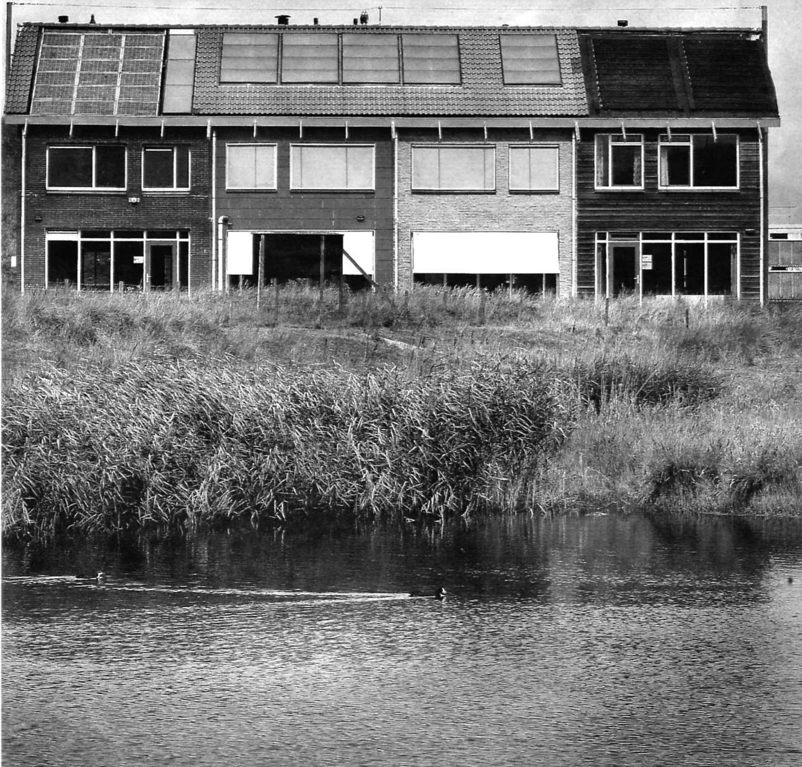
In Petten zijn enkele jaren geleden vier zogenaamde Ecobuild-woningen gebouwd. Elke woning heeft een andere bouwwijze, variërend van betoncascas tot houtskelet. Een van deze onderzoekswoningen is speciaal gericht op domotica-toepassingen. De andere drie worden ingezet voor onderzoek naar energiezuinige woningbouw. Daarbij moet onder meer worden gedacht aan vloer- en wandverwarming, warmtepompen en een hybride ventilatiesysteem.